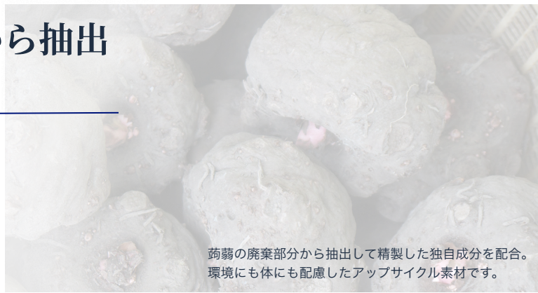
蒟蒻の廃棄部分から抽出して精製した独自成分を配合。環境にも体にも配慮したアップサイクル素材です。

このダブルの成分が、肌や脳のコンディションに内側からアプローチ。冴えわたる毎日と、溢れるような潤いを呼び覚まします。